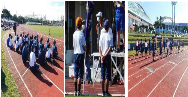
開会式や、準備体操の「AGEHA」もコロナ禍の影響で規模を縮小して行われました。

昨年度は、コロナ禍のため大会が実施されず、今回も規模を縮小して開催されました。本校からは、 3年生20名、2年生4名、1年生4名の精鋭 が各々のエントリーした競技に参加し、熱いレースが展開されました。その様子と競技結果をお知らせします。