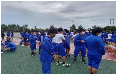
ジャケンゲームに負けた2年生！