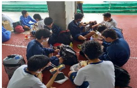
走る前の腹ごしらえ、3年生！