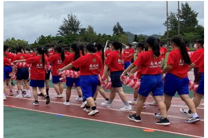
華やかな「美ら島エイサー」