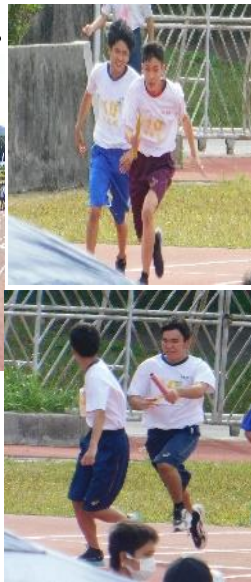
代表リレーでは、バトンと仲間の気持ちを繋ぎ頑張りました。女子は見事1位になりました。