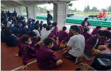
雨が止むのを辛抱強く待つ1年生！

今年も雨天に見舞われ進行が遅れただけでなく、午前午後の日程を入れ替え、晴れ間が覗いた午後には女子は 4.0kmを45分以内 、男子は 4.6km48分以内 、で走破しました。体育の授業で培った力が出せた大会でした。高支のみなさん、 グッド・ラン でした。