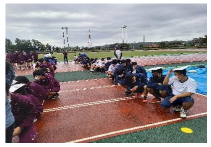
クジの抽選を見守る1・3年生！